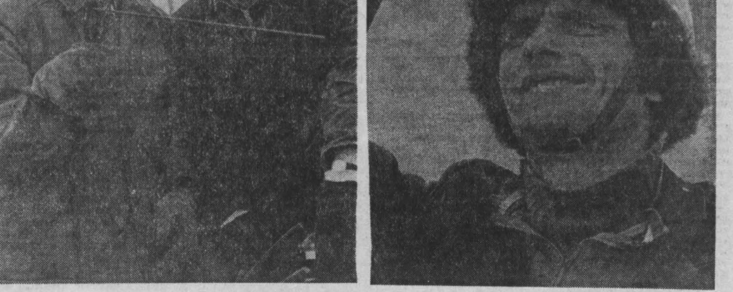
г. Тонки.