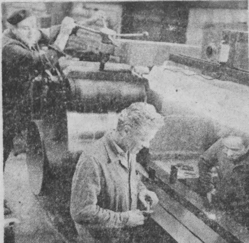
Три с половиной десятилетия — срок исторически не большой. Но за это время Венгрия превратилась из аграрной страны в высокоразвитое промышленное государство. Из года в год наращивает выпуск продукции и Шалготарьинский механический завод. НА СНИМКАХ: в цехе завода; весеннее солнце на улицах и площадях Шалготарьяна.