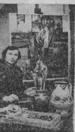
Имя художника Яноша Мушто известно далеко за пределами страны. В своих произведениях он рассказывает о сегодняшнем дне Венгрии, обращается к прошлому страны. НА СНИМКЕ: художник Янош Мушто.

Во всех 13 филиалах городской библиотеки имени Гоголя развернута сейчас выставка книг, посвященная Венгерской Народной Республике и ее успехам в строительстве развитого социализма. Проводятся здесь также и обзоры новинок. Всего намечено за время декады провести около 20 мероприятий. Наиболее интересными получились экспозиции в музыкальном отделе, посвященные 100-летию со дня рождения композитора Б. Бартока и классической венгерской музыки. Нарасхват сейчас и книги на венгерском языке в отделе иностранной литературы. Особенным спросом пользуются издания, подаренные гостями с берегов Дуная, в частности книга о Ноградской области. Кроме того, библиотека получает два журнала, издающиеся в Будапеште. А. АЛЕКСЕЕВ, г. Новокузнецк.