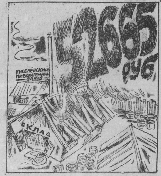
Когда нет дыма без огня.