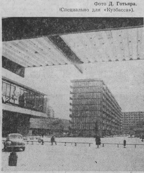
Фото Д. Готьяра. (Специально для «Кузбасса»).