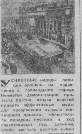
СИЛЕННЫЕ нарды полиции брошены на подавление в голландском городе Неймеген демонстрации протеста против отказа властей принять эффективные меры для преодоления острого жилищного кризиса. «Блестящие парадки» пустили в ход слезоточивый газ, дубинки, чтобы выгнать десант семей из занятых ими пустующих домов в центре города. По плану властей эти дома полны слезоточивым газом. Как сообщается, имеются раненые, полицейские произвели аресты.