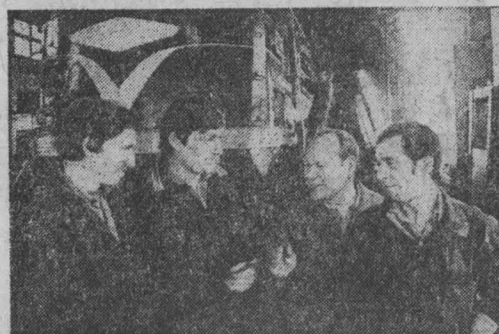
В день ленинского субботника рабочие Осинниковского погрузочно-транспортного управления решили отремонтировать тепловоз, отправить народному хозяйству более 40 тысяч тонн угля.

Совет Министров СССР поручил Госкомтруду СССР, Госплану СССР и Минфину СССР подготавливать с участием ВЦСПС, заинтересованных министерств и ведомств и представлять в Совет Министров СССР предложения о порядке и сроках осуществления указанных мероприятий.