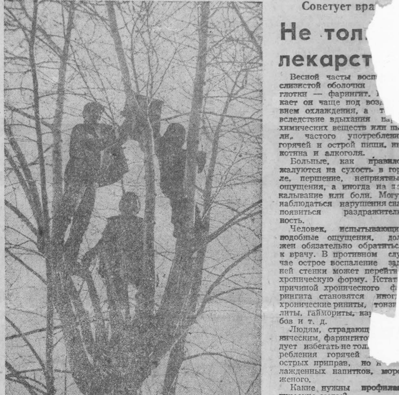
Для завтрашних пернатых гостей.

Раскатали безымянные сапоги и, высветивая путь фонариками, заша-