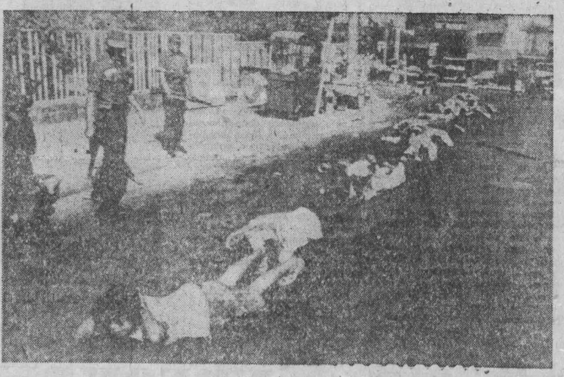
В ГОРОДАХ и сельской местности Сальвадора продолжают бесчинствовать марательные отряды и состоящие на службе режима террористические банды. Ежедневно жертвами террора становятся десятки человек.

ВАШИНГТОН, 31 марта. (ТАСС). Здесь совершено покушение на президента Ф. Рейгана. Некий Джон Хинкли, 25 лет, открыл огонь по президенту на рассвете, когда Ф. Рейган выходил из гостиницы в центре Вашингтона после выступления на профсоюзной конференции. Идент был тут же доставлен в медицинский центр имени Вашингтона, где ему была сделана операция по извлечению пули из легкого. Врачи характеризуют его состояние как «стабильное и хорошее». Он находится в сознании. Во время покушения тяжело ранен в голову пресс-секретарь Белого дома Дж. Брейди. Получили ранения один из агентов секретной службы и полицейский. Покушавшийся Джон Хинкли, сын крупного бизнесмена из г. Эвергрин (штат Колорадо), ранее находившийся под наблюдением психиатров. Агентство ЮПИ сообщает, что Хинкли ранее состоял членом национал-социалистической партии Америки, крупнейшей в США неонацистской группировки. Получив известие о покушении на Р. Рейгана, вице-президент Дж. Буш, находившийся в пути в Техас, отменил поездку и вернулся в Вашингтон.