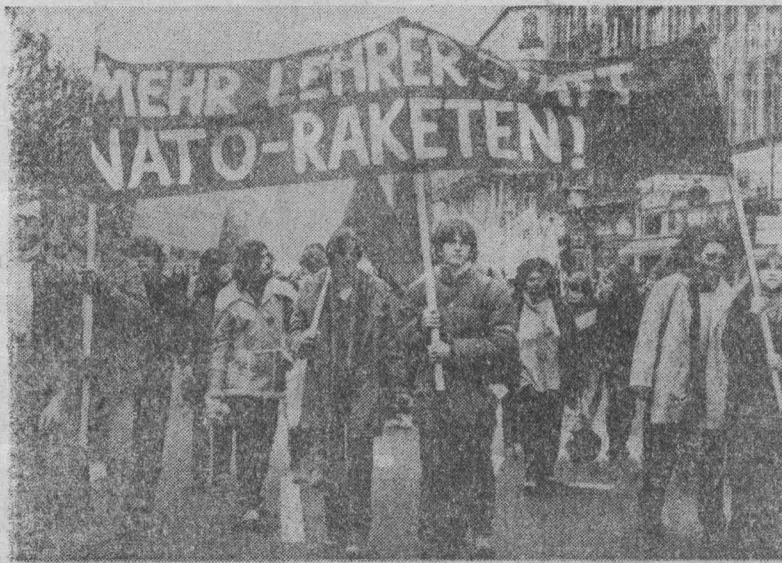
Использование западногерманской территории в милитаристских целях воиной США и НАТО, безудержная гонка вооружений, препятствующая разрядке и создающая бюджетные ассигнования, вызывают законное беспокойство у жителей ФРГ, требующие от властей внимания к жизненно важным проблемам населения страны.

Перейдя к ситуации на Ближнем и Среднем Востоке, Хейг снова дал волю своей фантазии, разглагольствуя о некоем «возможном вмешательстве» в дела государства этого региона со стороны Советского Союза. И опять же он не смог подтвердить свои голословные утверждения никакими-либо фактами. А факты таковы: неумозрительное «возможное вмешательство» Советского Союза, а самое реальное вооруженное вмешательство в этой части земного шара осуществляют именно Соединенные Штаты. Они сконцентрировали в зоне Персидского залива и Индийского океана самую мощную за всю историю военно-морскую армаду, создали многочисленные военные базы и опорные пункты. Не то иной, как Вашингтон, формирует 200-тысячные интервенционистские «силы быстрого развертывания», подготавливаемые к броску в этот нефтеносный регион. Ныне именно администрация Р. Рейгана спешно проталкивает план размещения американских сухопутных войск на Синайском полуострове. В результате всех этих провокационных действий США как в Центральной Америке, так и на Ближнем и Среднем Востоке создаются новые «горячие точки», что чревато возникновением вооруженных конфликтов. Но об этом госсекретарь по понятным причинам предпочел не упоминать.