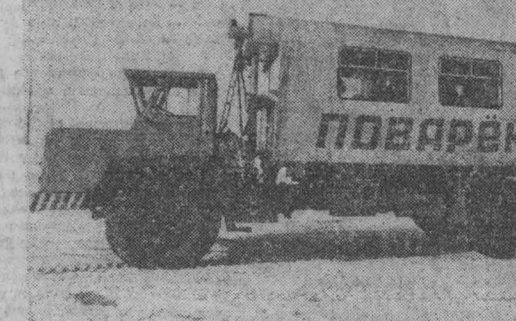
Фото В. Грышкина, г. Междуреченск.