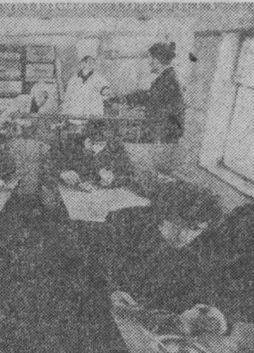
Фото В. Грышкина, г. Междуреченск.