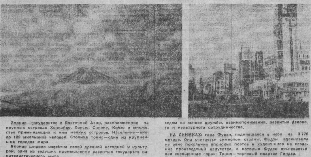
Япония — государство в Восточной Азии, расположенное на крупных островах Хоккайдо, Хонсю, Сикоку, Кюсю и множестве примыкающих и немалых островов. Население — около 120 миллионов человек. Столица Токио — один из крупнейших городов мира.