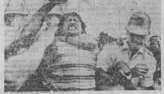
РАЗНОМ демонстрации в Веллингтоне коренных жителей страны — маори и арастаны манифестации была «отмена» национальный праздник — День Новой Зеландии. Маори вышли на улицы столицы, чтобы заявить решительное «нет» политике властей, которая поставила их в положение дискриминируемого национального меньшинства на собственной родине.

Сенат США большинством голосов рекомендовал президенту Р. Рейгану отменить эмбарго на поставки Советскому Союзу кормового зерна. Сенат США большинством голосов рекомендовал президенту Р. Рейгану отменить эмбарго на поставки Советскому Союзу кормового зерна.