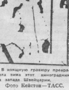
В изысканную гравиру преобразила зима этот анимационный фотозахват Швейцарии, Фото Кейтон—ТАСС.