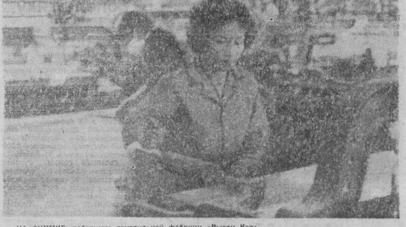
НА СНИМКЕ: работница текстильной фабрики «Рисен Кео» (Кампучия).