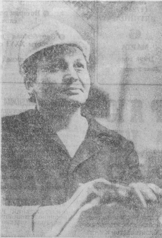
ЧЕЛОВЕК И ЕГО ДЕЛО

Многим производственным коллективам — победителям предъездовского соревнования — будут вручены на слетах почетные грамоты, дипломы, вымпелы. Среди тех, кто получит эти вымпелы, — объединение «Азот», Кемеровское монтажное управление № 1, Новокузнецкая ТЭЦ, производственное предприятие «Сибхимпромэнерго».