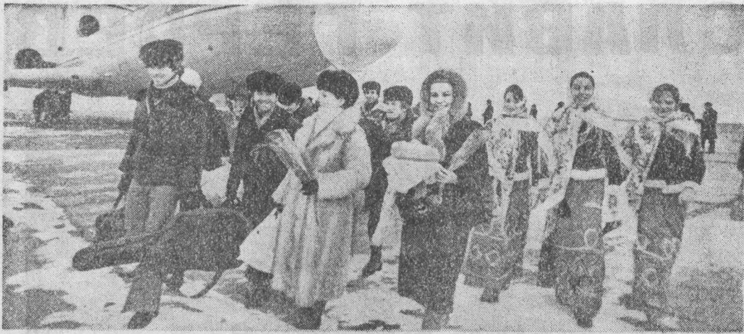
Для участия в культурной программе VII зимней Спартакиады народов РСФСР в Кузбасс прибыл государственный академический хореографический ансамбль «Бережка».