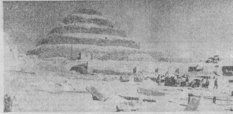
КАИР. В 20 километрах от египетской столицы находится район Санкара, известный замечательными историческими памятниками, в том числе древней ступенчатой пирамидой фараона Джосера (на снимке). Недавно чехословацкие археологи обнаружили здесь неизвестную до сих пор пирамиду, возраст которой — более четырех с половиной тысяч лет! Ее высота, по предварительным данным, 20 метров.