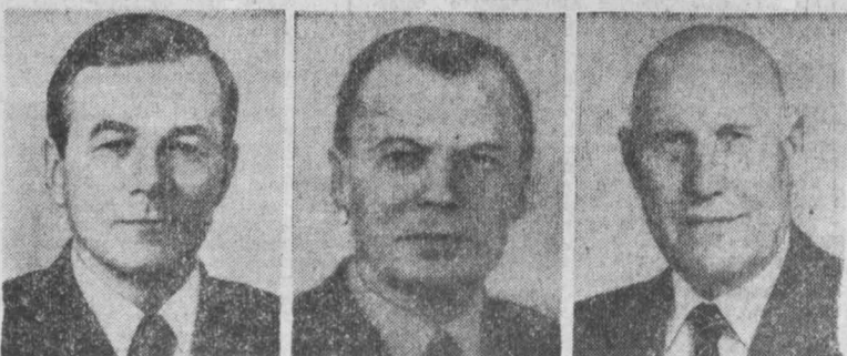
М. В. ЗИМЯНИН. Секретарь ЦК КПСС. К. В. РУСАКОВ. Секретарь ЦК КПСС. Г. Ф. СИЗОВ. Председатель Центральной ревизионной комиссии КПСС.