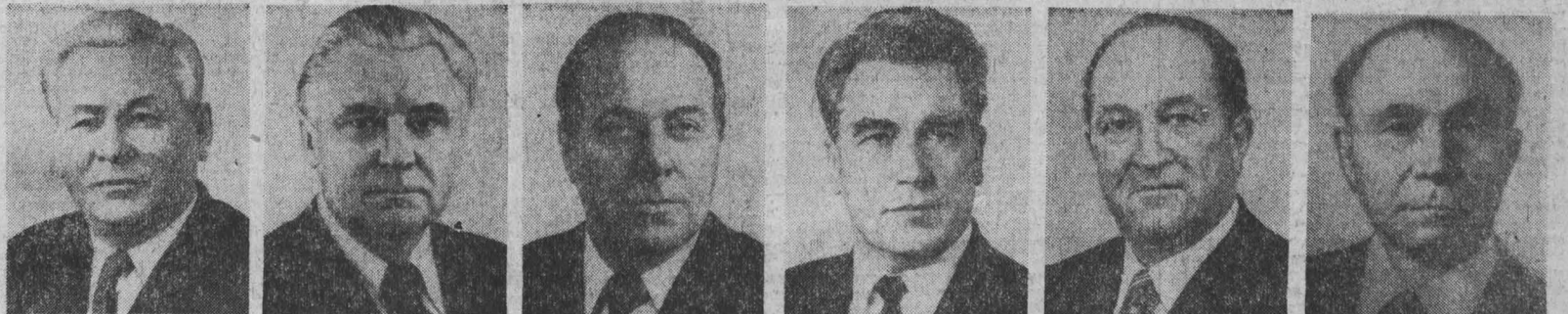
К. У. ЧЕРНЕНКО. Член Политбюро ЦК КПСС, секретарь ЦК КПСС. В. В. ЩЕРБИЦКИЙ. Член Политбюро ЦК КПСС. Г. А. АЛИЕВ. Кандидат в члены Политбюро ЦК КПСС. П. Н. ДЕМИЧЕВ. Кандидат в члены Политбюро ЦК КПСС. Т. Я. КИСЕЛЕВ. Кандидат в члены Политбюро ЦК КПСС. В. В. КУЗНЕЦОВ. Кандидат в члены Политбюро ЦК КПСС.

дерзания, являются исключительной ценной помощью болгарским коммунистам в подготовке очередного XII съезда БКП. Л. И. Брежнев выразил признательность за высокую оценку значения XXVI съезда и отметил, что обширные планы Советского Союза и Болгарии на 80-е годы открывают новые горизонты в развитии братских советско-болгарских взаимосвязей. Эти взаимосвязи — ценнейшее достояние обоих народов, важное слабое место успехов коммунистического и социалистического строительства. Встреча прошла в сердечной обстановке и подтвердила полное единство взглядов по обсуждавшимся вопросам. Во встрече принял участие секретарь ЦК КПСС К. В. Русаков. (ТАСС).