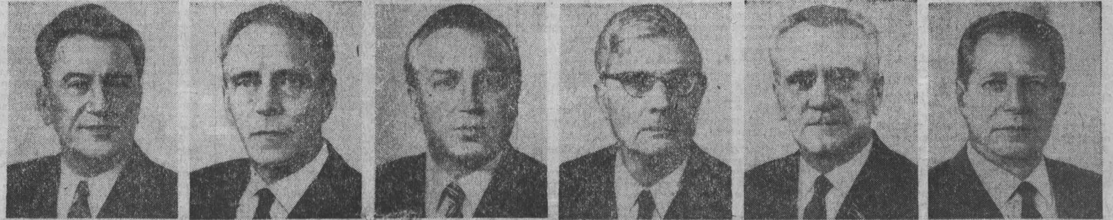
Д. А. КУНАЕВ. Член Политбюро ЦК КПСС. А. Я. ПЕЛЬШЕ. Член Политбюро ЦК КПСС, председатель ЦКК при ЦК КПСС. Г. В. РОМАНОВ. Член Политбюро ЦК КПСС. М. А. СУСЛОВ. Член Политбюро ЦК КПСС, секретарь ЦК КПСС. Н. А. ТИХОНОВ. Член Политбюро ЦК КПСС. Д. Ф. УСТИНОВ. Член Политбюро ЦК КПСС.

зоне Персидского залива и Индийского океана позволила бы разрядить взрывоопасную обстановку в этих регионах. Л. И. Брежнев отметил, что борьба народа демократического Йемена под руководством Йеменской социалистической партии за упрочение национальной независимости, развитие экономики и переустройство общества на социалистических началах встречает симпатию и поддержку со стороны КПСС и советского народа. На базе договора о дружбе и сотрудничестве крепнет всестороннее сотрудничество между Советским Союзом и демократическим Йеменом. В ходе беседы было выражено удовлетворение в связи с успешным развитием дружественных связей КПСС и ИСП. Встреча прошла в теплой, дружественной атмосфере. (ТАСС).