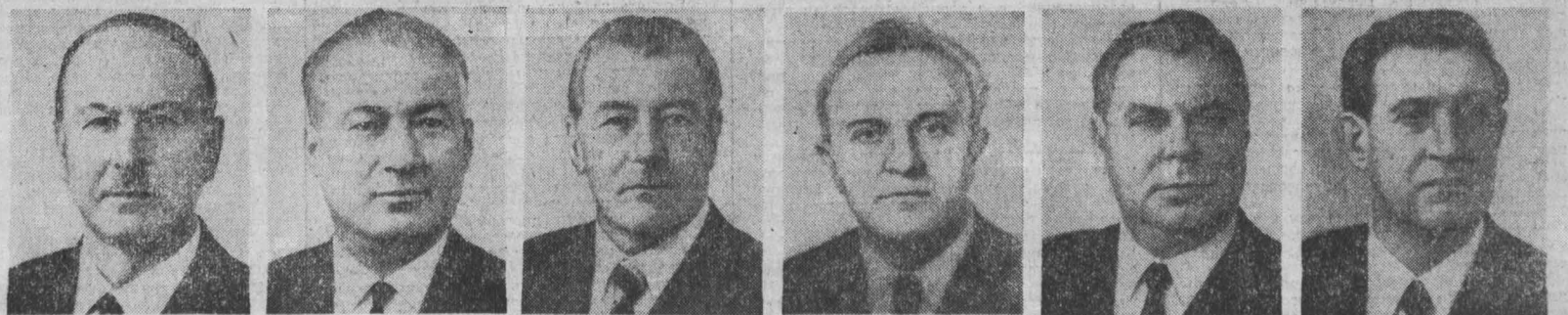
Б. Н. ПОНОМАРЕВ. Кандидат в члены Политбюро ЦК КПСС, секретарь ЦК КПСС. Ш. Р. РАШИДОВ. Кандидат в члены Политбюро ЦК КПСС. М. С. СОЛОМЕНЦЕВ. Кандидат в члены Политбюро ЦК КПСС. Э. А. ШЕВАРДНАДЗЕ. Кандидат в члены Политбюро ЦК КПСС. И. В. КАПИТОНОВ. Секретарь ЦК КПСС. В. И. ДОЛГИХ. Секретарь ЦК КПСС.