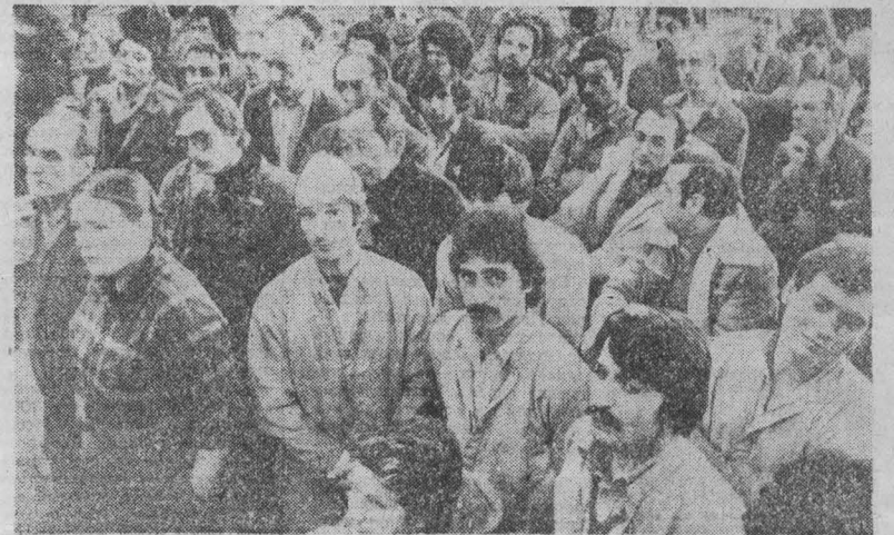
ТРУДНОСТИ, переживаемые автомобилестроением США, докладывают тяжелым бременем на плечи не только американских рабочих, но и их собратьев в Западной Европе.

тивники договора, мобилизовавшие свои силы с целью заблокировать ратификацию. Журнал предостерегает против попыток сломать основополагающие принципы, на которых был заключен ОСВ-2, подорвать его основы, затянуть на неопределенный срок введение в действие договора. В подобном случае, отмечается в статье, Советский Союз вправе прийти к выводу об отсутствии преимущества принимаемых администрацией США решений и о ее ненадежности в качестве партнера. «Буллетин оф атомик сайенс» призывает американскую администрацию не повторять ошибок Дж. Картера и на деле проводить курс на ограничение гонки вооружений.