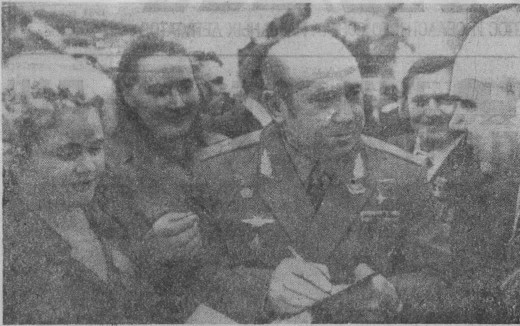
В КРЕМЛЕВСКОМ Дворце съездов продолжает работу XXVI съезд КПСС. НА СНИМКЕ: в перерыве между заседаниями. Летчик-космонавт СССР, дважды Герой Советского Союза, делегат от

Затем было продолжено обсуждение Отчета ЦК КПСС и очередных задач партии в области внутренней и внешней политики и Отчета Центральной ревизионной комиссии КПСС.