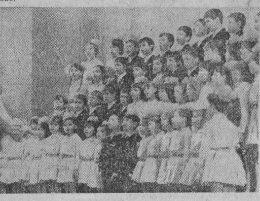
В областной филармонии состоялся отчетный концерт детских музыкальных школ Кемерово. Юных исполнителей пришли послушать родители и друзья, педагоги, специалисты в области музыки.

Несомненно, для слушателей концерт стал настоящим праздником.