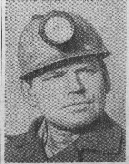
Рассказываем о делегатах XXVI съезда КПСС

При обязательстве 40 тысяч тонн горняки Осинники выдали в честь партийного съезда 67 тысяч тонн угля сверх плана с начала года. Наибольший вклад вносят шахтеры «Капитальной», «Шушталепской», «Алардинской». В дружной семье передовиков шагают и горняки шахты «Северный Кандыш», разреза «Осинниковский».