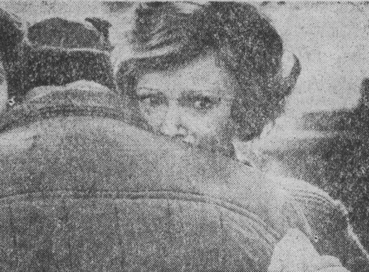
НА СНИМКАХ: кадры из кинофильма «Особо важное задание».

старика рассказывали о себе, о заводе, о войне. Поразительные, душе, переживавшие воспоминания. Сейчас удивляешься, как можно было выдержать такое. Казалось, нет больше сил, человек падал от усталости, но вставал и продолжал работу. Предела человеческого невозможно не было. Невозможного не было. Невозможным было только потерять Родину, Отечественная война не обесценила обычные человеческие чувства, люди все равно мечтали, спорили, влюблялись, сорились и мигали. Жизнь шла своим чередом. Без этого естественного, как дышание, мира не существует и наших героев... А. АЛЕШИНА, г. Кемерово.