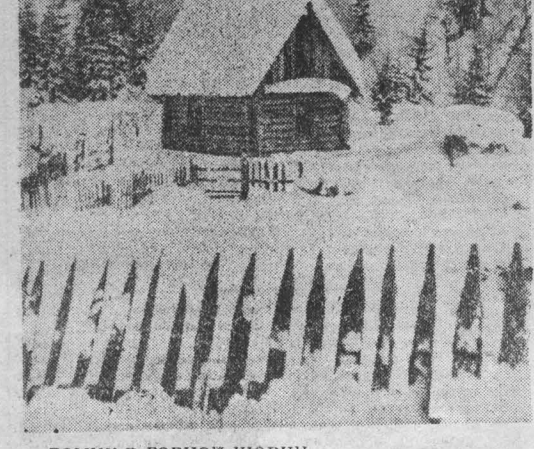
ДОМИК В ГОРНОЙ ШОРНИ.

В достоинствах синтезатора уже убедились специалисты минского производственного объединения имени В. И. Ленина.