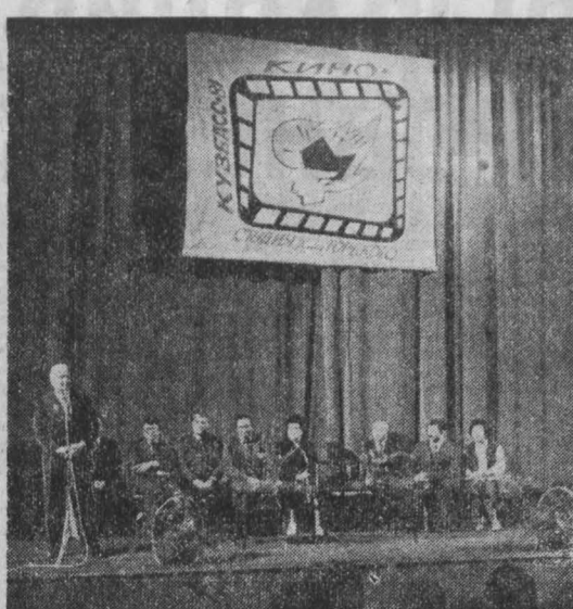
г. Кемерово.

мент торжественного открытия кинофестиваля.