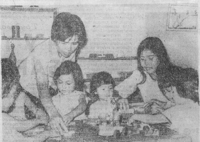
ЗНАЧИТЕЛЬНО увеличилось в Социалистической Республике Вьетнам за годы второй пятилетки число детских дошкольных учреждений. Сейчас в стране свыше 46 тысяч садов и яслей, которые посещают более 1,2 миллиона малолетних граждан республики.

На предприятиях Варшавы, Броцлава, Катовице в последние дни распространились листовки действующего под эгидой «Солидарности» т. н. «польского движения сопротивления», в которых содержатся инструкции о методах борьбы против ПОРП, польских коммунистов.