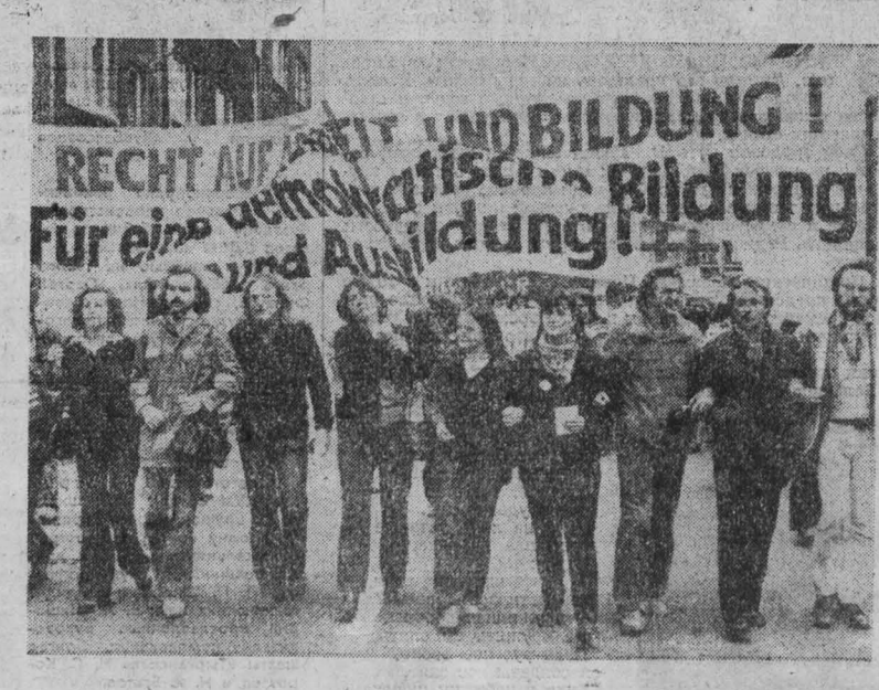
ФРГ. Обеспечение молодежи полноценно конституционного права на профессиональное образование и возможность трудиться требует от властей прогрессивная молодежь (на снимке — демонстрация в Дортмунде). По словам газеты «Унзер тайт», десятки тысяч юношей и девушек, окончивших в прошлом году школу, были вынуждены начать свою жизнь с биржи труда. В настоящее время в стране более 200 тысяч молодых людей не могут найти ни места ученика на производстве, ни работы.

Удовлетворенности следить за выполнением условий протокола Рио-де-Жанейро, который устанавливает границу между Перу и Эквадором. На нем было принято последнее решение министров иностранных дел Перу и Эквадора, в котором содержится призыв полностью отказаться от применения силы при решении пограничного конфликта и урегулировать свой территориальный спор мирным путем.