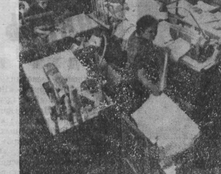
Цех № 2 — ведущий на швейной фабрике «Искра». Впервые на фабрике именно здесь начали шить изделия со Знаком качества. В цехе-поточке изготавливают сегодня мужские сорочки из хлопка, нейлона и других материалов. Многие изделия выпускаются со Знаком качества, с индексом Н.