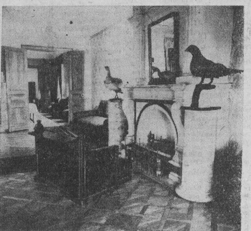
нуться в гущу народной жизни, слушал образную речь Ярославского крестьянина, любившего красноту природы.