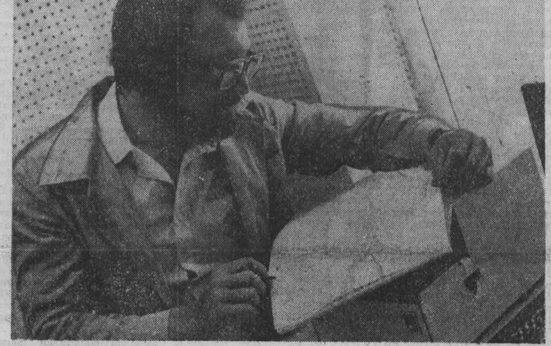
г. Кемерово.