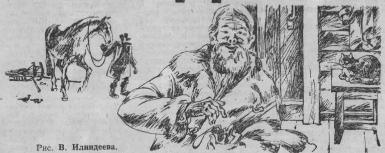
Рис. В. Иллариона

«Капризную прастеню», и советовало: мол, приди по весне, научу и покажу. При этом он косился на бумажку-лоток Якова так, будто она могла принести какую-нибудь неприятность. — Приду. Завтра же. А сегодня — сны.