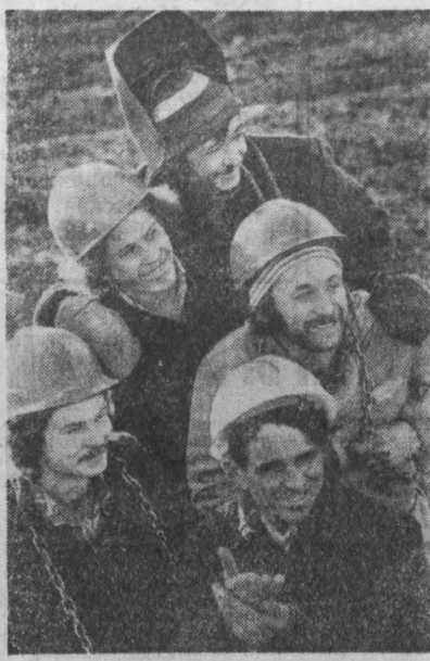
Отчеты и выборы