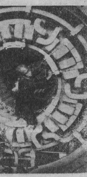
ЧССР. В решающий этап вступило сооружение одного из гигантов чехословацкой энергетики — тепловой электростанции «Прунериов-IV» в Хомутовском районе. После завершения всех работ ее мощность составит 1050 мегаватт.

рые нацелены на индийские города, увеличена огневая мощь воинских частей. Кроме того, Китай построил ряд военных объектов на оккупированной им в 1962 году части индийской территории.