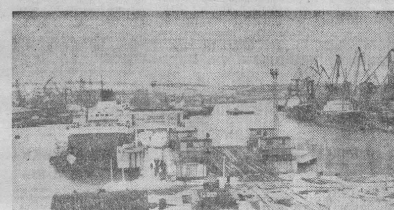
ХАВАРОВСКИЙ КРАИ. За годы десятой пятилетки коллектив морского торгового порта Ванино сверх плана переработал 249 тысяч тонн грузов, получила дополнительную прибыль 914 тысяч рублей, производительность труда по сравнению с 1975 годом выросла на 31 процент.

К половине двенадцатого машины сделали лишь по два рейса. В двенадцать мы от-