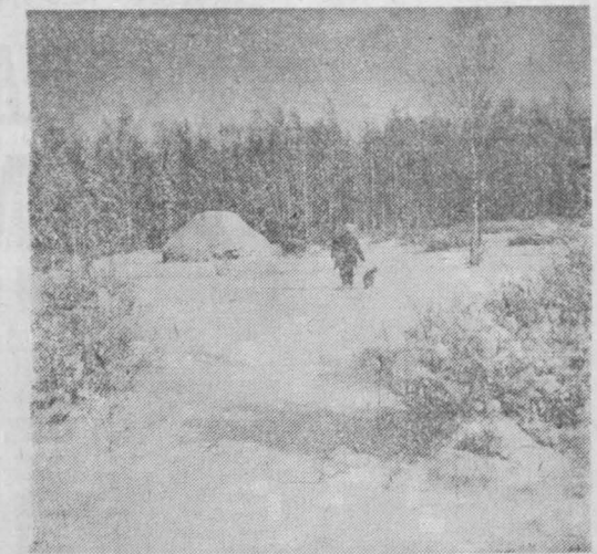
ДЕКАБРЬ — ПОРА ОХОТНИЧЬЯ.

Профилактический уход за кожей лица особенно необходим тем, кто зимой долго находится на ветру и морозе. Низкая температура воздуха, снег, ветер резко раздражают кожу лица: от этого усиливается ломкость кровеносных сосудов, нарушается питание кожи, появляется шелушение, покраснение. Лица с сухой и нежной кожей лица очень чувствительны к внешним раздражителям длительной сибирской зимы. Рекомендую им умыть лицо утром без мыла, но кипяченой водой. Для смягчения кожи можно добавить питьевую соду (половина чайной ложки на один литр). Предварительно смягчить кожу лица растительным маслом, сливками или жидким кремом сутра. Перед выходом на улицу (за 30—40 минут) воспламенить сухую кожу лица, склонную к обморожению, можно защитит тонким слоем перетопленного внутреннего свиного сала или гусиного жира. Для того, чтобы кожа лица была эластичной, упругой и устойчивой к внешним раздражителям, нужно ее закалять. Полезно протирать лицо по утрам льдом из отвара петрушки, ромашки (не более двух—трех минут). Вечером можно накладывать питательные маски. Во врачебно-косметической лечебнице областного центра