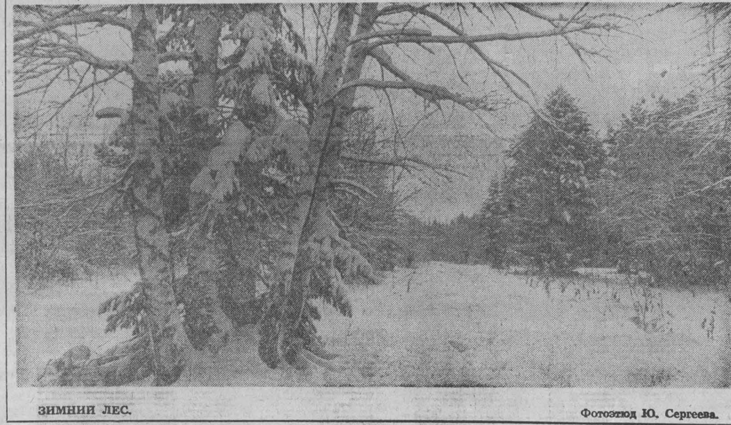
ЗИМНИЙ ЛЕС.