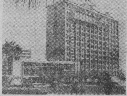
В 1962 году Алжир стал независимой народно-демократической республикой. За годы самостоятельного развития страна окрепла в экономическом и политическом плане. С момента провозглашения независимости владея республика взяла курс на укрепление государственного сектора в экономике.

Участники встречи заслушали сообщение шеф-редактора