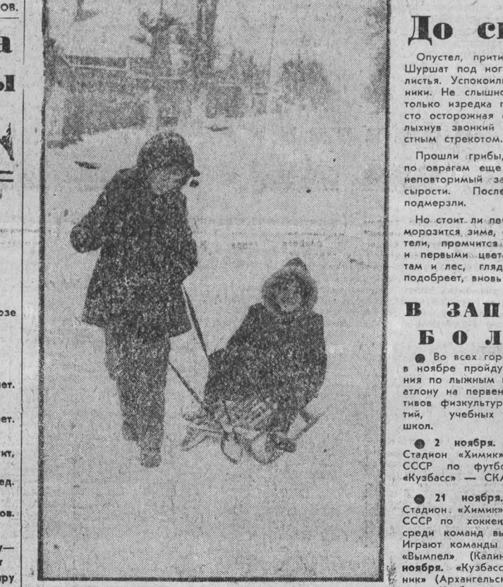
ПО ПЕРВОМУ СНЕГУ.

За рошу, голый мус ли Ушло, ушло тепло... Как радостные мысли, Снежок парит светло. Как мысли о морозе, Который встретим мы; О том, что в буднях, Есть лирика зимы. ☆☆☆ На низком небе — облачность врзлет. Там редко за день солнышко проглянет. Над белым полем ветер шарлатани, В реке все крепче сковывает лед. Предзимья вет ветер от стогов. А ночь придет, рассеет мрак по миру — Луна, светясь, настраивает лиру На песню вьюг, на музыку снегов.