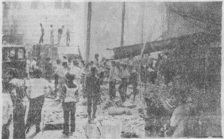
Израильская агентура в Ливане совершила новое гнусное злодеяние. В момент, когда население Беirut жило обычной деловой жизнью, раздалась чудовищная сила взрыва. Разрушены жилые и административные здания, магазины. Имеется большое число жертв.

Достигнутые двусторонние договоренности в экономической сфере, продолжил он, необходимо наполнить конкретным содержанием. В частности, широкие перспективы сотрудничества открываются в области энергетике. В этой связи О. В. фон Амеронген подчеркнул заинтересованность западногерманской стороны в осуществлении сделки с СССР по схеме «трубы-газ», предусматривающей строительство газопровода для транспортировки в Западную Европу, в том числе в ФРГ, советского природного газа.