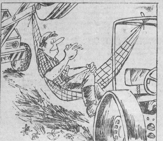
Рис. В. Иллешева.

Наша семья живет в проспекте Химиков. Хлеб мы покупаем в магазине «Будничная», расположенном на бульваре Строителей. Уже не первый раз приходится выбрасывать круглый хлеб стоимостью 26 копеек, так как попадаете (и, наверное, не только нам) хлеб непропеченный — под румяной корочкой сплошно-