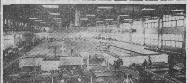
Кубок Сибири по спортивной гимнастике — сравнительно молодой турнир...