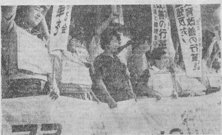
Каждый из 117 миллионов японцев лишится 10 тысяч иен в год в результате намечаемых правительством административных реформ.