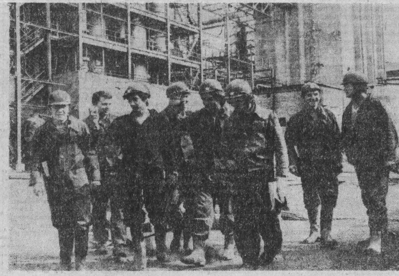
СТУДЕНЧЕСКИЙ строительный отряд Кемеровского государственного института культуры «Мечта» нынешний трудовой семестр провел на стройках областного центра. Сособой теплотой говорят о бойцах ССО «Мечта» в тресте «Строймеханизация». Студенты отлично поработали на благоустройстве территории