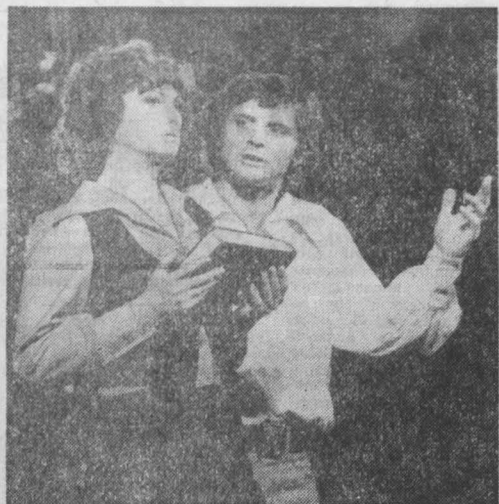
Первая премьера сезона стала современной легендой испанского драматурга А. Касонова «Дикарь» («Третье слово»).

следим за их работой, участвуем в выездном заседании коллегии этого журнала в нашей области. На него приедет большая группа критиков, которые посмотрят спектакли всех театров области, проанализируют их. После Москвы у театра были гастроли в Полтаве и в Симферополе. В Симферополе играли на сцене театра, артезианский зал которого вмещает более тысячи человек, и практически каждый вечер он был полон. Кроме того, играли в других городах Крымской области, в здравницах. Харьковская и Крымская студии телевидения взяли некоторые наши спектакли для показа. И в Полтаве, и в Симферополе коллектив был награжден Почетными грамотами обкомов КПУ и облисполкомов. За последние годы коллектив наш побывал на гастролях почти в 30 крупных городах Советского Союза, и ни в одном из них о нас плохо не говорили и не писали. Думаем, кемеровчанам есть за что любить свой театр. Вот с такими настроениями и чувствами начинаем мы новый сезон. — Афиши приглашают на две ближайшие премьеры — спектакли «Дикарь» А. Касонова и «Комната». Э. Брагинского, а на что зрители могут рассчитывать в перспективе? — В наших творческих планах постановка «Отелло» В. Шекспира, «Вишневый са-