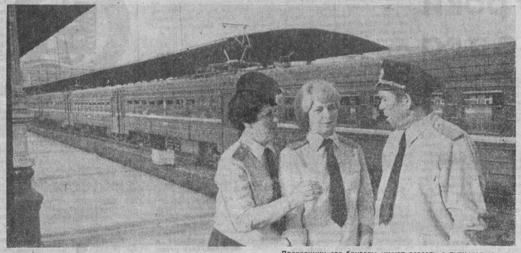
Проводники его бригады умеют создать в пути уют для тех, кто проводит несколько дней на колесах.

Кузнецкий госпромпхоз каждый год заготавливает семена ценного растения — левзеи (маралий корень)... Кузнецкий госпромпхоз каждый год заготавливает семена ценного растения — левзеи (маралий корень).