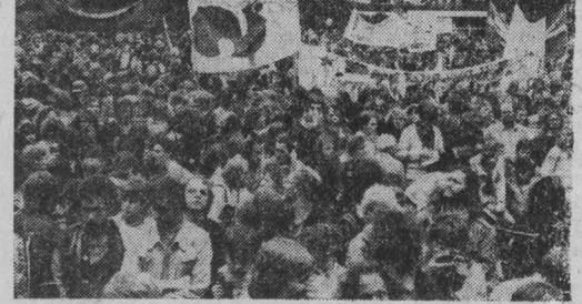
ФРГ. Массовая демонстрация сторонников мира и разрушения составила в Гамбурге (на снимке). Десятки тысяч человек вышли на улицы города, чтобы заявить свой протест против гонимых вооруженных, размещенных на территории ФРГ новых американских ядерных ракет средней дальности. Демонстрация прошла под лозунгом «Атомная смерть угрожает всем нам!».

ДАМАСК, 9 октября (ТАСС). Гибель Садата означает полный провал его курса, его «политиче-