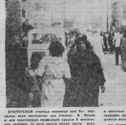
ЕГИПЕТСКАЯ столица является как бы зеркалом всех нынешних зол страны. В Кане и его пригородах проживает свыше 8 миллионов человек, то есть почти пятая часть всех египтян. Особой перенаселенностью страдают кварталы с обветшалыми, покрытыми пылью и копотью строениями, замусоренными тротуарами, рынками и ухабами на улицах, где ютятся малолетки.

«Вот непоколебимая платформа, на которой мы можем строить взаимопонимание. В это чрезвычайно трудное время будут применяться чрезвычайные методы деятельности, подчеркнул В. Ярузельский. Мы стремимся к тому, заявил он, чтобы все общество провело понимание и поддержку власти в их усилиях по соблюдению правопорядка и борьбе с различными нарушениями. Эту задачу я поставил перед министерством внутренних дел, деятельностью которого в соответствующем объеме будет поддержана выделенными войсками. Углубляющейся бездельностью, хулиганской разнузданности, антигосударственным и антисоциальным выходкам, игнорированию правовых и нравственных норм должен быть популен конец».