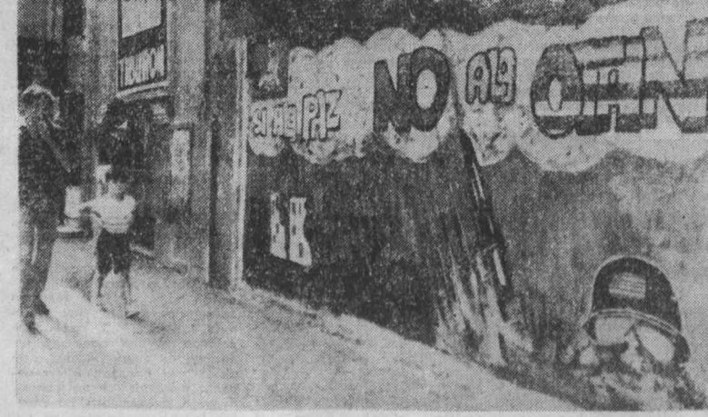
В ИСПАНИИ ширится движение протеста обеспокоенности страны против планов втягивания страны в агрессивный блок НАТО.

НА СНИМКЕ: на улицах Мадрида.