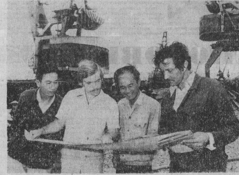
ХАЙФОН — крупный порт социалистической Вьетнама, через который проходит две трети морского грузопотока страны.

Принято 22 сентября 1981 года на митинге многоотраслевого коллектива производственного объединения «Уралмаш».