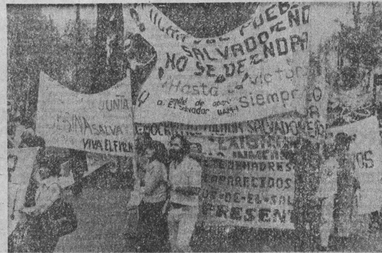
Прогрессивные силы всего мира поддерживают борьбу народа Сальвадора за свободу и демократию.

ОТАВА, 22. (ТАСС). Канада не намерена следовать политике Соединенных Штатов в отношении Сальвадора, заявила, выступая в палате общин федерального парламента, премьер-министр Канады П. Тридо. Мы не разделяем и не поддерживаем, подчеркнул он, оккупацию сальвадорской хунты военной помощью.