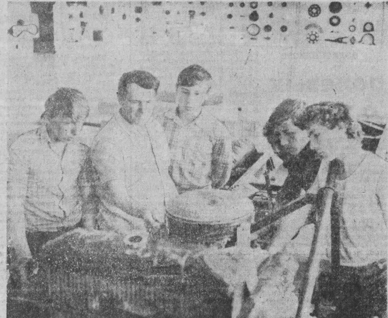
Яшинский межшкольный учебно-производственный комбинат занимается трудовой подготовкой и профессиональной ориентацией школьников. Здесь обучаются шестьсот учащихся из 13 школ района по девяти специальностям. Это трактористы, операторы машинного доения, швей, шоферы, строители и др. После успешной учебы школьники сдают экзамены на присвоение квалификации. В нынешнем, четвертом выпуске аттестовано двести учащихся. НА СНИМКЕ: в автомобильном классе будущие шоферы. р. п. Япкинко.