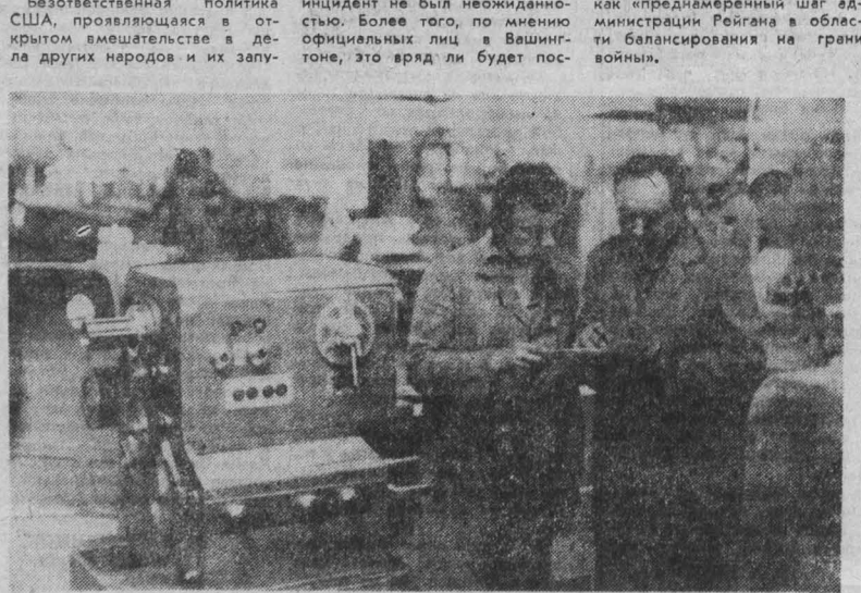
НАРОДНАЯ РЕСПУБЛИКА БОЛГАРИЯ. Город Троян славится издревле гончарным и столярным промыслами. На снимке: комбинат металлорежущих станков в Трояне.

«Есть определенные признаки того, что весь инцидент был провокацией в рамках американской стратегии, с целью подтолкнуть Ливию к решению этой проблемы», — отмечает телекомпания Эй-Би-Си, напоминая, что «Рейган лично отдал приказ о проведении этих маневров, которые тем самым бросили вызов Ливии». Газета «Вашингтон пост» пишет: «Вчерашний воздушный инцидент не был неожиданным. Более того, по мнению официальных лиц в Вашингтоне, это вряд ли будет последним эпизодом такого рода. Этот инцидент неизбежно приведет к серьезным дипломатическим и политическим последствиям в Африке и на Ближнем Востоке».