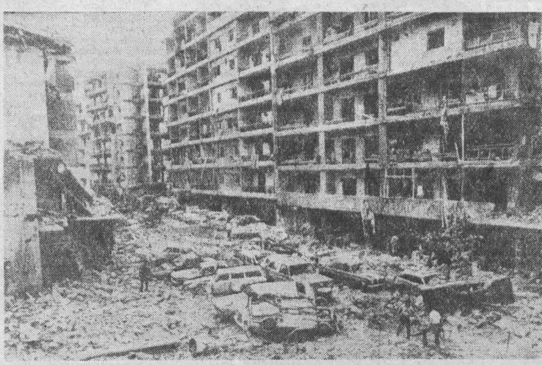
Осуждение террора. НА СНИМКЕ: разрушенный израильской авиацией квартал в западной части Бейрута.

НЬЮ-ЙОРК, 18. (ТАСС). С частотным призывом к администрации США возобновить советско-американский диалог в области ограничения вооружений выступил видный американский политический и общественный деятель бывший председатель сенатской комиссии по иностранным делам У. Фулбрайт. В статье опубликованной в газете «Мэйкам гэральд», он пишет, что «самой зловещей угрозой», нависшей над человечеством, является «третья мировая война с применением ядерного оружия». Однако, отмечает У. Фулбрайт, в Белом доме есть «безответственные лица, которые полагают, что такую войну можно начать и выиграть». Они даже считают, что угрозу войны можно использовать как инструмент давления на Советский Союз — с целью заставить его изменить свою политику. Рассуждая так, подчеркивает Фулбрайт, сенатор, значит не понимает, какую угрозу несет ядерный конфликт. В настоящее время, пишет У. Фулбрайт, в мире скопи-