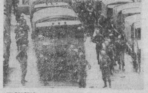
НА СНИМКЕ: японские солдаты на одном из причалов Токиоского порта перед очередными учениями по подготовке к чрезвычайной ситуации.

САН-ФРАНЦИСКО, 18. (ТАСС). Политика вавинтонской администрации, запрещающей или ограничивающей экспорт современной технологии в Советский Союз, наносит финансовый и политический ущерб прежде всего сам Союзным Штатам. К такому выводу пришли авторы специального доклада, подготовленного авторитетной исследовательской фирмой «Рэнд корпорейшн». В докладе отмечается, что недальновидный курс Вашингтона ставит в невыгодное положение американские корпорации на мировом рынке. Его инициаторы исходят из ложной посылки, будто США являются главным торговым партнером Советского Союза. На самом же деле США экспортируют в СССР в стоимостном выражении только одну десятую того оборудования и технологии, которые поступают из Англии, Франции и ФРГ, говорится в исследовании.