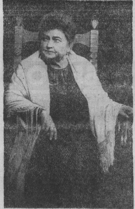
Беседу записал И. БЕЛЛИН, г. Кемерово.

Встречи с Илоной у себя дома и в ее комнате в школе, где только что невестка Марта искала своего мужа, — опережающие в развитии характера Старой хозяйки. В первом разговоре она еще уверена, что ничего особенно не случится, надо только предостеречь девушку от напрасных надежд и ненужных