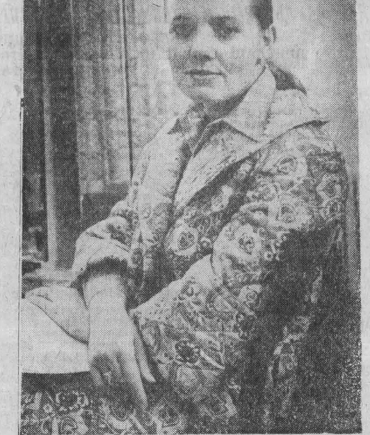
г. Кемерово.