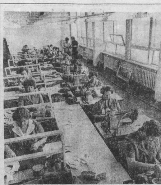
Сфера услуг — сфера культуры

П. КОШЕЛЕВ, старший музыкальный редактор филармонии. г. Кемерово.