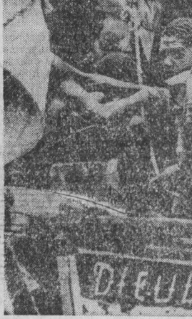
Фотопортрет группы беженцев из Ганги, спасающихся от жестокайших репрессий диктаторского режима Жан-Клода Дювалье — ставленника США, пытающихся найти приют в Америке. Препятствием на этом пути являются утиль суденышки типа «флориды», на которых беженцы пытаются пересечь проливы Флориды, они надеются, что в США их, как правило, ожидают тюрьмы, депортация, полуголодное существование и унижающее бесправие.

Со своей стороны, министр национальной обороны Франции Ш. Эрню, выступая в военном училище города Сомюр, сообщил, что новое французское правительство намерено продолжать «весь комплекс исследований в области вооружений, в том числе и в области нейтронных видов оружия». По его утверждению, это необходимо для того, чтобы «добиться уважения к тем, чтобы к нашему голосу прислушались две великие державы, какими являются США и СССР». Между тем, как известно, наибольшее уважения на международной арене Франция добилась не в годы подчинения натовской политике гонки вооружений, а лишь тогда, когда она стала проводить действительно независимую политику и выступила за разрядку и сотрудничество со всеми государствами, за прекращение логики блоков, против равенства на планы Пентагона.