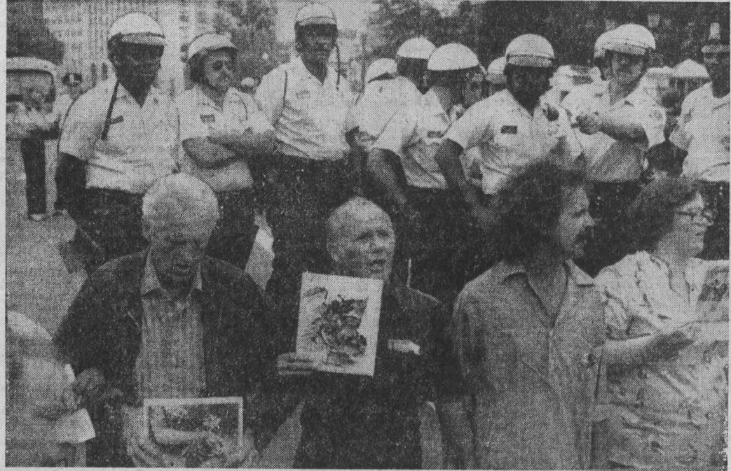
США, 80 человек были арестованы полицией и агентами секретной службы за участие в демонстрации протеста американской общности Вашингтона против милитаристского курса нынешней администрации, ее вмешательства в дела других государств.