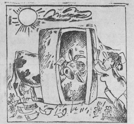
Рис. В. Илидзева.