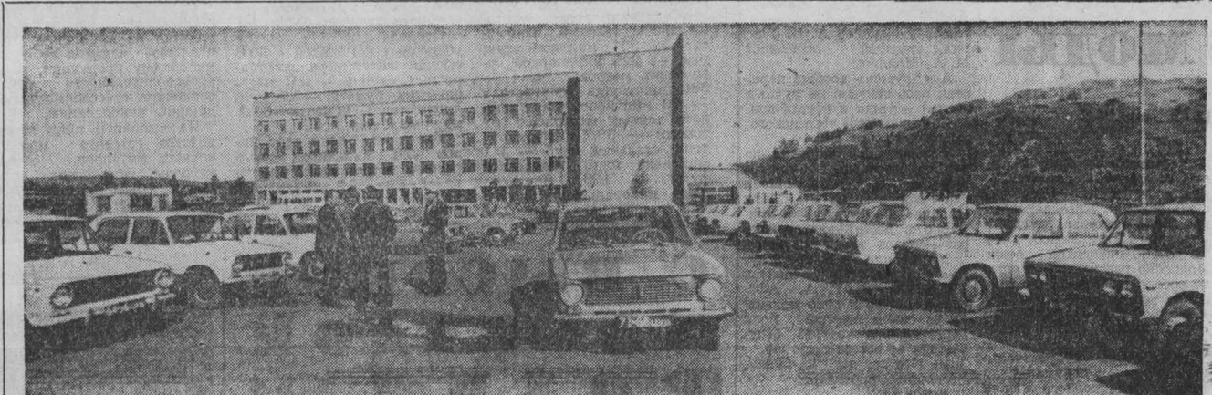
(Продолжение. Начало на 1-й стр.)

Численность населения Советского Союза на 1 июля 1981 года составила 267,7 миллиона человек (ТАСС).