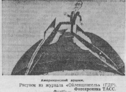
Американский аршин. Рисунок из журнала «Ойленшпигель» (ГДР).

Соединенные Штаты продолжают раскрывать гонку вооружения, осуществляя жандармские функции защиты своих жизненно важных интересов в различных районах земного шара. (Из газет).