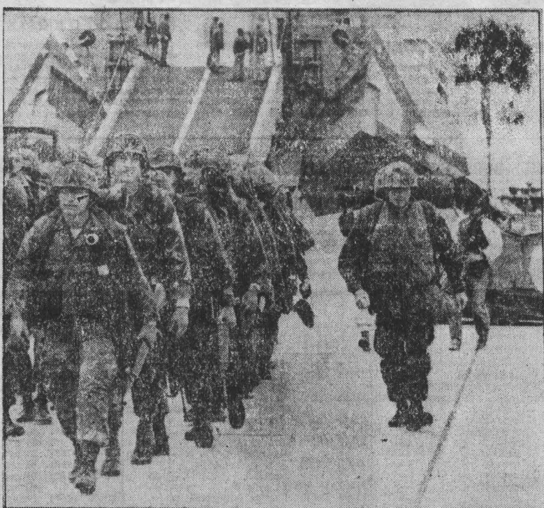
Лицемерный характер подобных заявлений, официальных Вашингтона, рассчитанных на то, чтобы ввести в заблуждение мировое общественное мнение, виден уже из высказываний того же Уайнбергера. Обрисовав прощальную камуфляж, он прямо заявил, что США «не рассматривают в настоящее время возможность сокращения военной помощи Израилю».

ПРАГА, 24 июля. (ТАСС). Все центральные и региональные газеты на первых страницах под заголовками «Полное единство взглядов», «В сердечной атмосфере», «Крепится всестороннее сотрудничество» публикуют сообщение о встрече в Криму Генерального секретаря ЦК КПСС, Председателя Президиума Верховного Совета СССР Л. И. Брежнева с генеральным секретарем ЦК КПЧ, президентом ЧССР Г. Гусаком. Печать подчеркивает, что руководители обеих партий и государств подтвердили полное единство взглядов по вопросам взаимного сотрудничества и современного международного положения. Товарищи Л. И. Брежнев и Г. Гусак, отмечает орган ЦК КПЧ газета «Руде право», в обстановке сердечности обсудили широкий круг международных проблем и уделили особое внимание европейским делам. Европа не должна вновь стать театром военных действий, да еще с применением