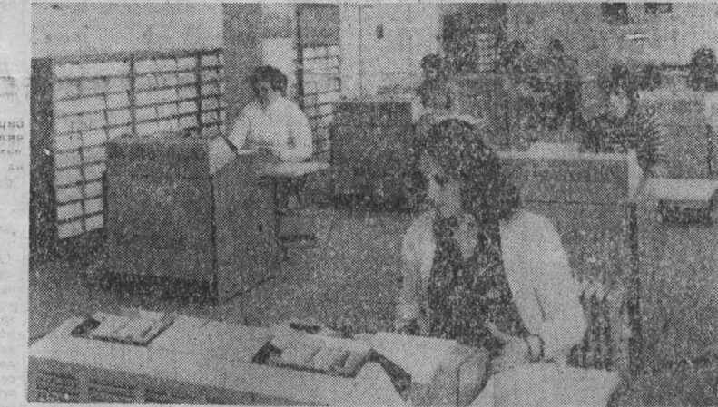
НАРОДНАЯ РЕСПУБЛИКА БОЛГАРИЯ. Болгарская женщина — равноправная труженица во всех областях народного хозяйства. Она вносит весомый вклад в социальные и экономические достижения страны, участвует в социальном управлении, в развитии науки, культуры, здравоохранения.

но, что лейпцигское судилище превратилось в суд над нацистами. Димитров разоблачил подлинный смысл нацистской провокации, доказав, что коммунисты не имеют никакого отношения к поджогу, а ван дер Люббе в своем отношении к коммунистическому движению и был лишь орудием в руках нацистских провокаторов. В историю вошли слова сказанные Димитровым подлинному организатору поджога Герингу: «Вы боитесь моих вопросов, господи министр-президент!» Суд был вынужден оправдать Димитрова и его коллег. Зато к смертной казни был приговорен Маринус ван дер Люббе, поведение которого на суде было еще более странным, чем в здании рейхстага. Он не мог связно говорить и время от времени беззвучно смеялся. По непо-