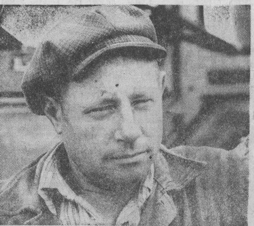
Адрес опыта: Кемеровский совхоз-техникум

Трудно уберечь поле, наполненное запахом свежего сена, от любителей «отдыха на природе», в результате разбитые, промоченные дождем стога, потери ценных питательных свойств кормов, нередки даже случаи поджога. Немало хлопот доставляет транспортировка сена с поля на фуражный двор, солидная часть его остается в оленках, много терится по дороге. Поэтому специалистами нашего хозяйства единодушно принята технология заготовки сена в прессованном виде. Однако существующая технология заготовки при помощи пресс-подборщика ПСБ-1.6 с проволочной вязкой имеет свои недостатки. Проволочные обрывки нередко попадают в пицевод животных и травмируют его. При складировании тюнов прямоугольной формы необходимо строго соблюдать правила укладки в шахматном порядке, оставляя специальные вентиляционные каналы, в противном случае тюны могут испортиться.