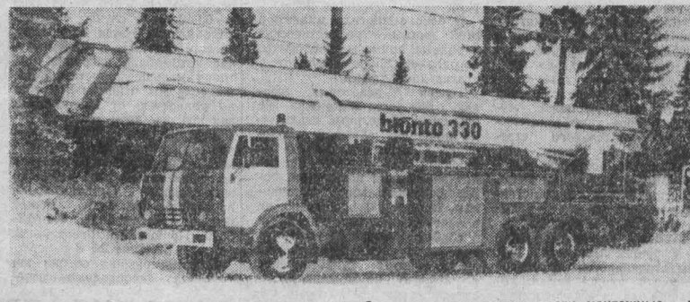
С его помощью можно вести монтажные и другие работы на высоте до 30 метров.

▲ НЬЮ-ЙОРК. В Союзных Штатах в широких масштабах практикуется дискриминация женщин в сфере труда. С таким откровенным признанием выступила газета «Нью-Йорк таймс», отмечая, что американские женщины получают за одинаковый с мужчинами труд меньшую зарплату, причем этот разрыв постоянно растет. Если в 1955 году, пишет газета, работавшие женщинам в среднем платили 64 цента по сравнению с долларом, то теперь получают за такой же труд мужчины, то в прошлом году эта цифра упала до 60 центов. «Нью-Йорк таймс» указывает, что американкам, как правило, предлагают наименее квалифицированные и соответственно хуже оплачиваемые должности.