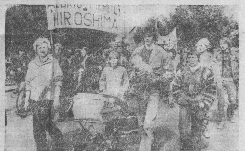
МАРШ мира 1981 года начался в столице Дании. Его участники — представители женских организаций Дании, Норвегии, Швеции и Финляндии — проделали пешим путем через ФРГ, Голландию, Бельгию и Францию и закончат марш 6 августа в Париже. Манифестанты пройдут под лозунгами борьбы против ядерного оружия, за создание безъядерной зоны на севере Европы, за превращение Европы в зону, свободную от ядерного оружия.