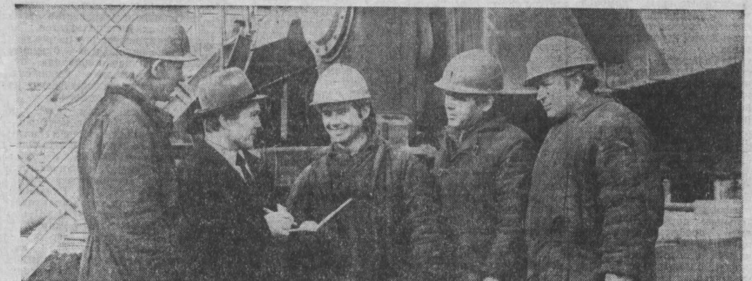
Как положено. Часто муку утратили в мешках.

Только из-за этого в течение двух лет потеряно 600 тонн продукта.