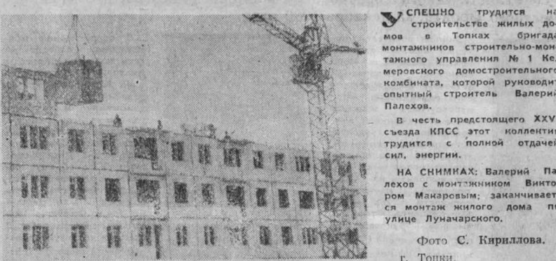
Успешно трудится на строительстве жилых домов в Топки бригада монтажников строительного управления № 1 Кемеровского домостроительного комбината, которой руководит опытный строитель Валерий Палехов.