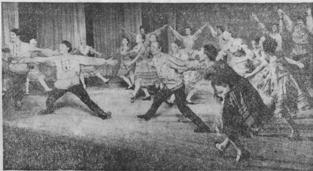
г. Кемерово.

А. АЛЕШИНА. На снимке: будущие балетмейстеры исполняют «Сибирский плес».