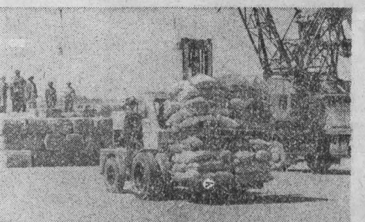
Новое все решительнее утверждается на древней афганской земле. Народно-демократическая партия и правительство ДРА направляют свои усилия на развитие хозяйства, нормализацию жизни населения, поднятие культурного уровня, укрепление всенародного единства.