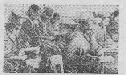
Борьба с врагами апрельской революции стала всенародным делом. Рабочие Джангалакского авторемонтного завода — крупного предприятия афганской столицы — с оружием в руках пришли на занятия курсов по ликвидации неграмотности. В любой момент они готовы дать отпор бандитам.