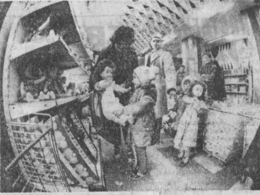
В. ПЕТРОВА.

НА СНИМКЕ: праздник детской игрушки в магазине «Звездочка».