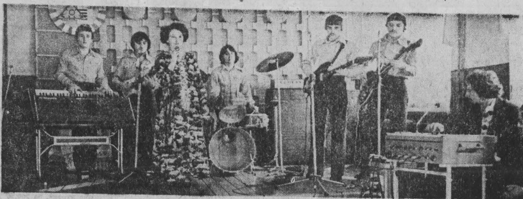
Яйский район.

на него сразу не ответить. Молодые люди — всегда дети своей страны. Тем они и хороши. Я не сужу о молодежи по громкой музыке и аляповатой одежде. Это не глубинная ее суть. Это пена. И мода на нее, по-моему, проходит. Меня как историка радует включение народной культуры. В Литве я была приятно поражена огромным количеством самодельных этнографических ансамблей, тем вниманием, которое уделяется фольклору, народной музыке в этой и других прибалтийских республиках. — Прибалтика — ваша родина. Не скучаете по ней? Какой разлуки? Не хотели бы вернуться? — Да, в Литве я родилась и выросла. В 1942 году эмигрировала в Вене, Инсбруке, Мюнхене и других городах. Шла война, кругом была неразбериха. Потом вышла замуж, уехала в Америку. По моей теме — древняя история Западной Европы — там было очень мало исследований и отличие, например, от Советского Союза, Англии. Удалось заниматься на протяжении многих лет своей любимой наукой. Но по родине скучала. О, как не скучать! Это невозможно. Все издаваясь возвращаться. Но то война, то дети, то всякие житейские проблемы. Пока были живы мать и другие родственники, которые жили в Литве, я не так ощущала свою отчужденность. А теперь вот мечтаю: поеду на пенсию, может, тогда... — В Выльнесе я была десять лет назад, и вот теперь только несколько месяцев буду читать там лекции. Перемены произо-