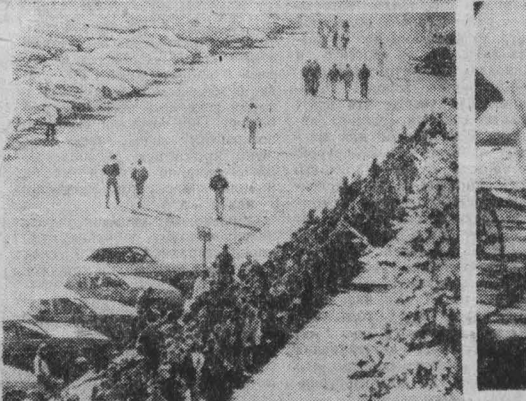
▲ США. Очередь за получением работы стала типичной картиной для многих городов Соединенных Штатов. Желающих оказывается всегда в сотни, а то и в тысячи раз больше, чем это требуется предприятию.

В очередной сводке ФНО сообщается, что партизаны сблизил населенного пункта Сан-Фернандо боевой вертолет «Хьюи» американского производства.