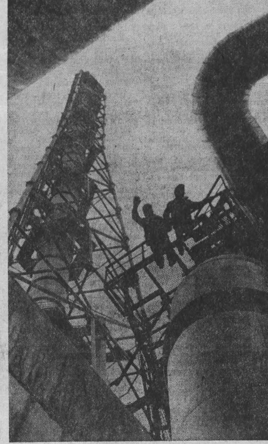
Успешно начал правоплавающий и новую пятилетку. Трехмесячное задание они выполнили на 178,9 процента.