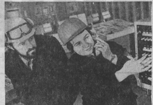
Успешно завершил задание первого квартала одиннадцатой пятилетки коллектив производственного объединения «Азот». Дополнительно химии реализовали продукцию на два миллиона рублей.

Здесь немало производств, которые трудятся в эти дни с опережением графика. Так, например, свою первую трудовую победу одержал коллектив цеха слабой азотной кислоты, основанной в последние три месяца раньше срока.