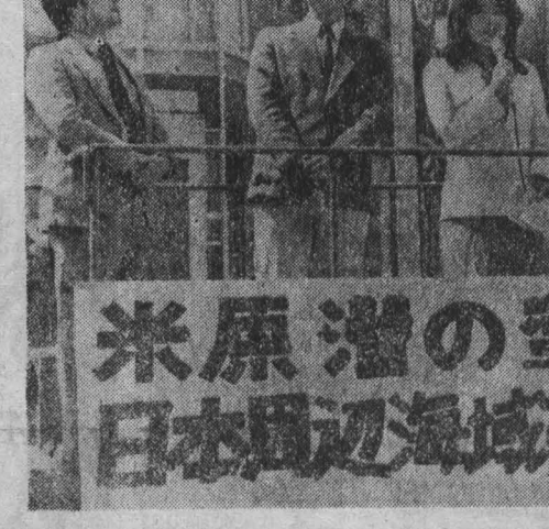
Гибель японских моряков и сухогруза «Ниссио-мару», бесчеловечность экипажа американской атомной подводной лодки «Джордж Вашингтон», просящего на произвол судьбы команду попавшего на японский остров, глубоко потрясли жителей Японских островов.

Во всем этом стоит Соединенные Штаты, которые путем организации подобных «дней солидарности» пытаются создать видимость региональной поддержки военно-гражданской хунты и тем самым надеются укрепить и стабилизировать ее. Видя, что военные меры, в том числе масштабная военная поддержка хунты со стороны Соединенных Штатов, не дают желаемого эффекта, Вашингтон начинает действовать по различным направлениям и прибегает, в частности, к пропагандистским шоу наподобие коста-риканского «совещания». Негативное отношение США к политическому решению сальвадорской проблемы, подчеркивается в совместном заявлении Фронта национального освобождения имени Фабрицио Марты и Революционно-демократического фронта, ведет лишь к расширению кровопролития и еще к большим жертвам в этой центральноамериканской стране.